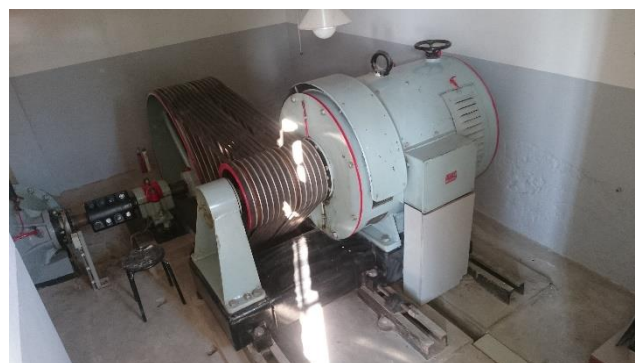
De in 1942 gebouwde 3 fase 380 V sleep-ringanker motor met borstelkortsluitinrichting. Vermogen 162 KW, de op de poelie gemonteerde aandrijfsnaren zijn nog de originele snaren.

Nieuw in het museum is het zicht vanuit de entree direct op de aandrijfmotor van de oostelijke centrifugaalpomp.